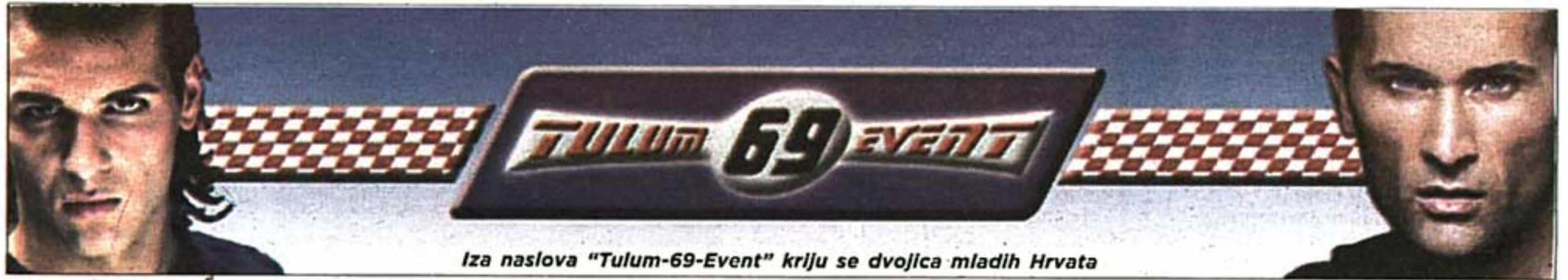
Iza naslova "Tulum-69-Event" kriju se dvojica mladih Hrvata

- Na tulumima svira samo hrvatska zabavna glazba, a ne narodna, kako je većinom u diskovima. Takve folk glazbe nema, jer je ovo hrvatska zabava. Uz zabavnu hrvatsku pjesmu pušta se i R'n'B i House glazba. Od tih vrsta, naravno, dominiraju aktualne stvari, ponekad i one već zaboravljene. Tulumu se organ-